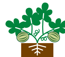
РАЗВИТИЕ ПЛОДА РАСТЕНИЯ